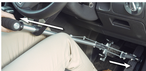
04. グリップを手前へ引くとアクセルがかかります。