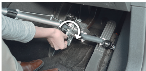
01. ブレーキペダルを挟み、ノブを締めて固定します。