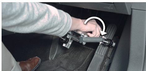
02. アクセルペダルを挟み、ノブを締めて固定します。*1