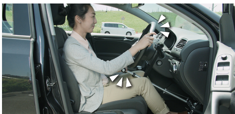
02. 左手でグリップを、右手でハンドルを持ちます。