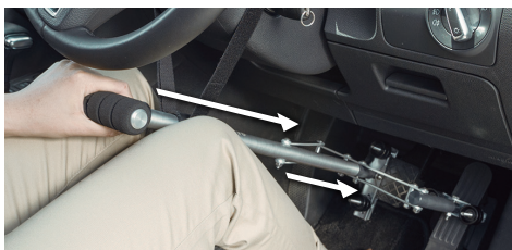
03. グリップを奥へ押すとブレーキがかかります。