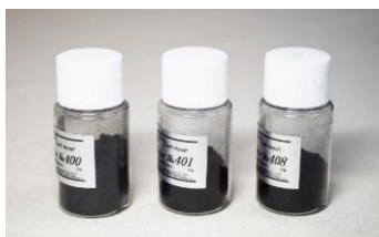
ブラック系3本セット ブラックの定番色の3本セット