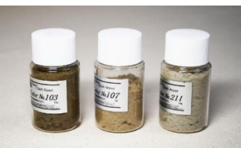
ベージュ系3本セット ベージュの定番色の3本セット