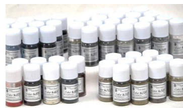
ファイバークロス2g 51種類から単品で購入可能