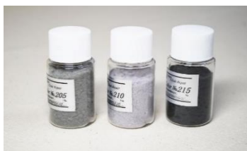
グレー系3本セット グレーの定番色の3本セット