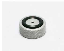
ターゲットアプター 打撃点大きい時に使用