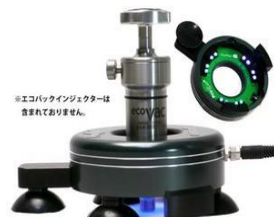
プロキュア2 LED 10V~30V対応