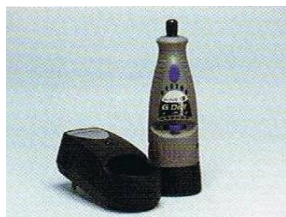
ドリル&バッテリーチャージャー