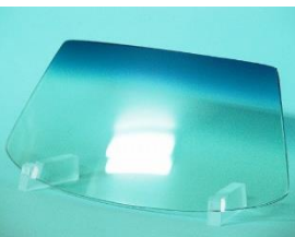
ディスプレイガラス 330mm×160mm